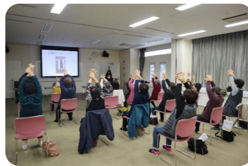
リフレッシュ体操をする様子

参加者の方より「家でもやってみます」「良いお話も聞けたし体と気分がスッキリしました」との感想をいただきました。