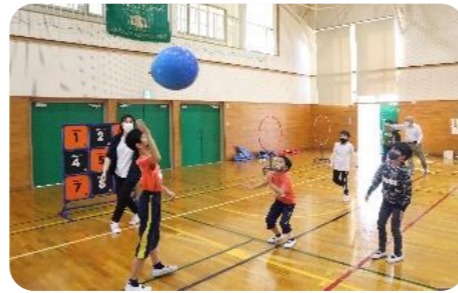
風船バレーをする参加者

※『ユニバーサルスポーツ』とは、年齢や国籍、障がいの有無に関わらず、皆と一緒に楽しむことができるスポーツのことです。