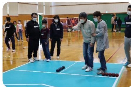
ポッチャを体験する参加者