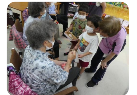
じゃんけんゲームの様子

あつという間の時間でしたが、利用者からは「かわいかったなー」「また来てほしい」と嬉しい言葉を頂き、幸せなひとときでした。